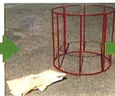
フレコンキーパー 組立完成時