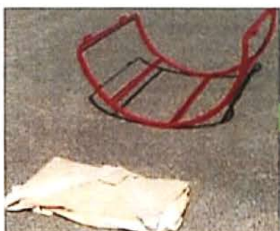
フレコンキーパーの 搬入時