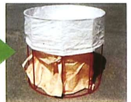
フレコンバッグを 取り付けたところ