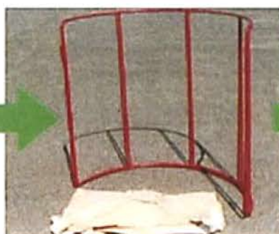
フレコンキーパー 組立前