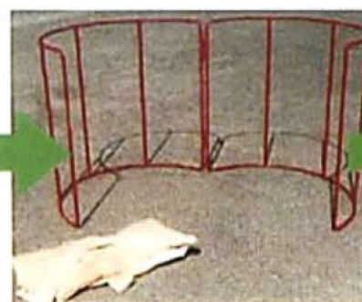
フレコンキーパーの 組立時